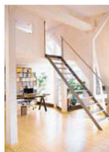
Das ausgebaute Dach bringt mehr Raum und Licht ins Haus.