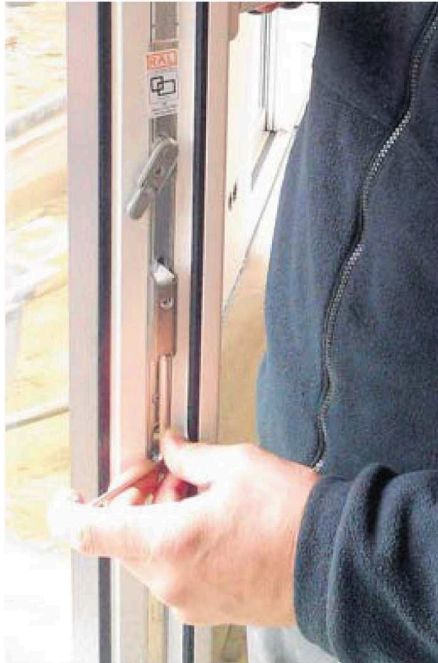
Beim Fensterkauf sollte man immer auf das RAL-Gütesiegel achten.